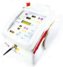
Der Weichgewebs- und Bleachinglaser von BIOLASE

Bleaching mit Laser Smile ist mit 24 Minuten Behandlungszeit gegenüber 60 Minuten bei anderen Zahnaufhellungssystemen ohne Laser besonders günstig. Das Laser Smilebleaching-Gel maximiert die Wirksamkeit der Aufhellung durch eine ausgeklügelte chemische Formel und laseraktivierte Chromophore.