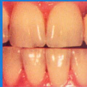
vor der Behandlung

Das Laser Smile Bleaching System ist von der amerikanischen Gesundheitsbehörde FDA schon 1960 geprüft und zugelassen worden. Das System wurde seitdem weiter entwickelt und optimiert. Selbst bei Überempfindlichkeit kann die Stelle mit einem Flur-Gel abgedeckt werden.