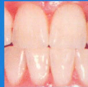
nach der Behandlung mit dem Laser Smile Bleaching System